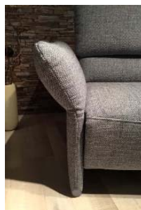
A - fest Breite ca. 16 cm

Armlehnen A und B sind baugleich zu C und D, jedoch bodentief und mit Kunststoffgleitern versehen