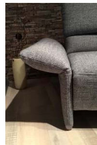
B - klappbar Mehrpreis s. Preisliste Breite ca. 16 - 28 cm